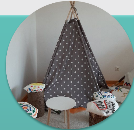
Hort und Hortlerngruppe